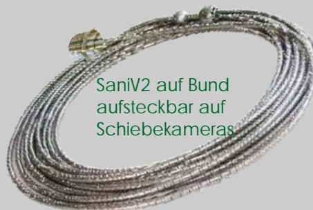
SaniV2 auf Bund aufsteckbar auf Schiebekameras

Die "Zubehörkamera" im 10m Bund zu bestehender Technik aufsteckbar auf unsere Hausschiebekameras regelbares LED-Licht NW 40 - NW 100 mehrfach bogengängig