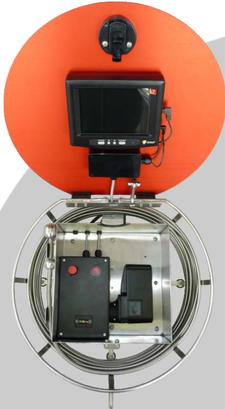
Version Akku / LCD

40cm Durchmesser/14cm Höhe 30mm Farbkamera mit LED-Licht regelbares LED-Licht Videoausgang LCD-Monitor Arbeitsbereich NW 40 - NW 100 mehrfach 90° bogengängig